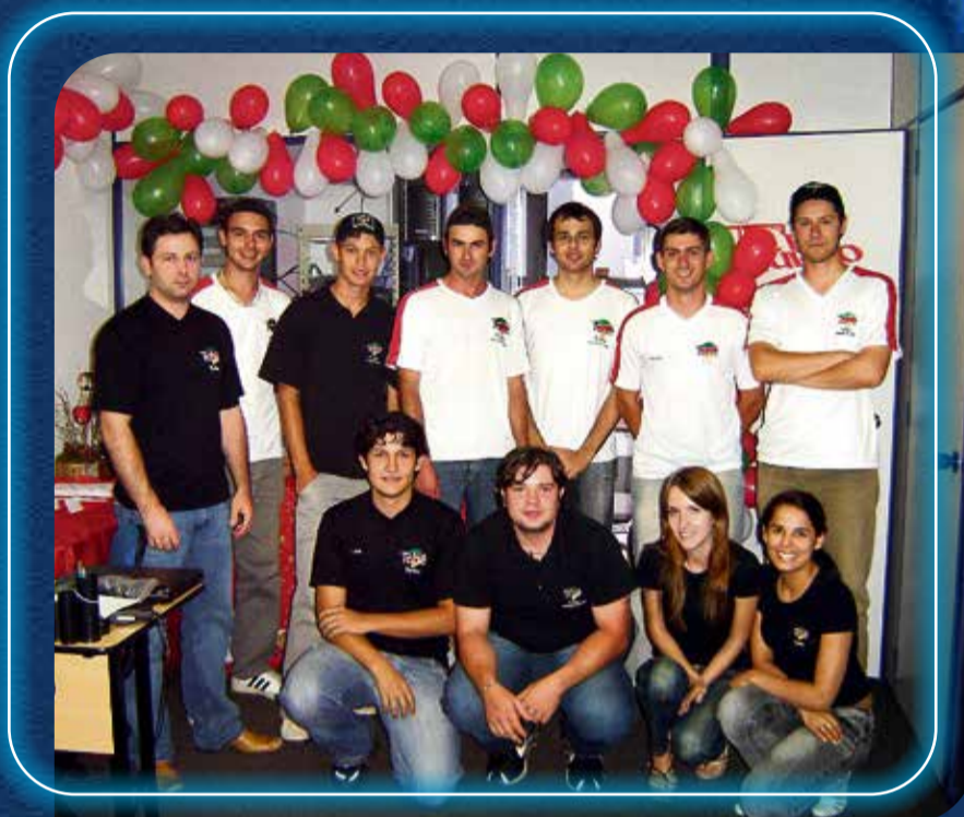
Equipe em 2007