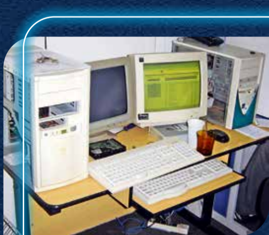
Equipamentos (E) e servidor (D) em 2005