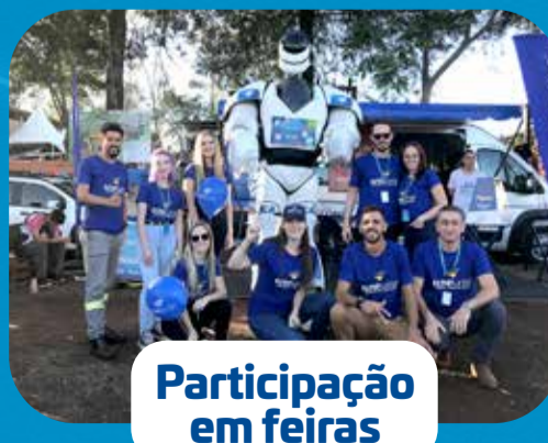
Participação em feiras

É realizada pela equipe que, com a unidade móvel, visita os municípios da região que possuem fibra óptica, mas que não têm uma loja física da Tchêturbo. Na oportunidade, os moradores podem contratar, conhecer os produtos, efetuar pagamentos, solicitar suporte ou atendimento.