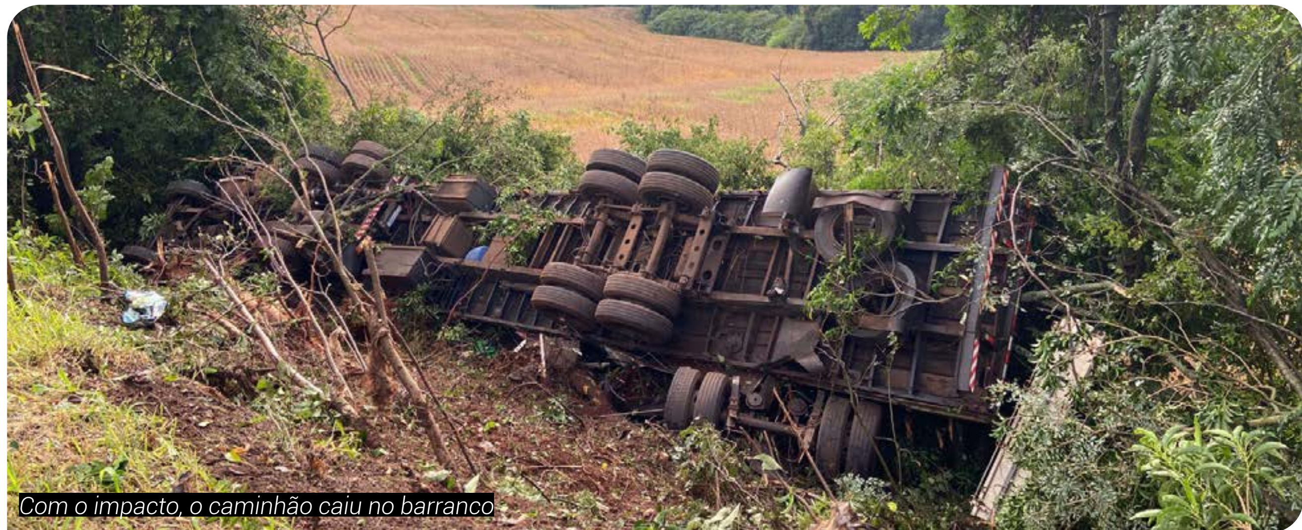
Com o impacto, o caminhão caiu no barranco