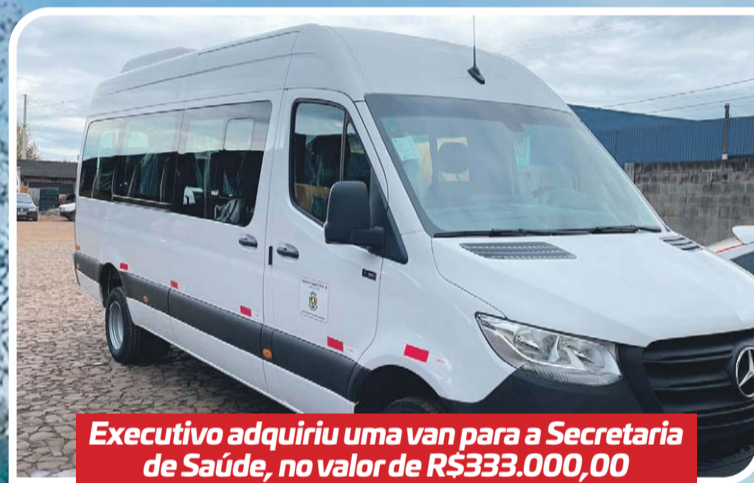
Executivo adquiriu uma van para a Secretaria de Saúde, no valor de R$333.000,00