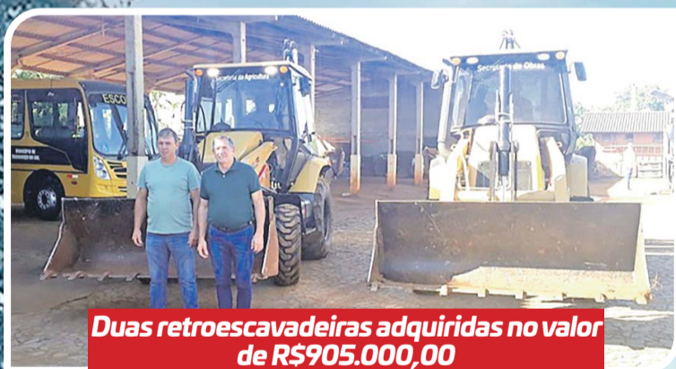
Dois retroscavadeiras adquiridas no valor de R$905.000,00