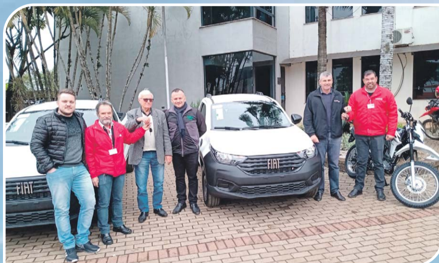
Constante renovação de frota de veículos das Secretarias da Saúde e Educação, visando garantir maior segurança para motoristas, pacientes e alunos.