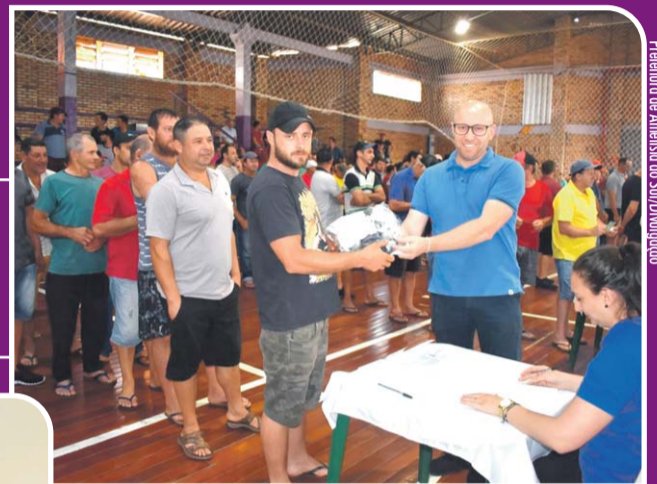
Distribuição de cestas básicas aos garimpeiros pertencente às PLGs que tiveram a atividade de mineração suspensa.