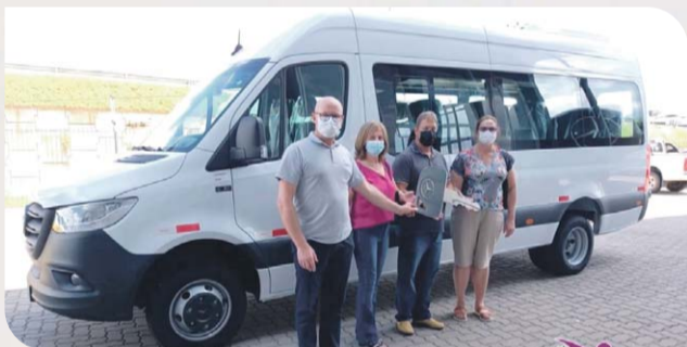
Aquisição Sprinter Van, no valor de R$ 211.790,00, para Secretaria da Educação