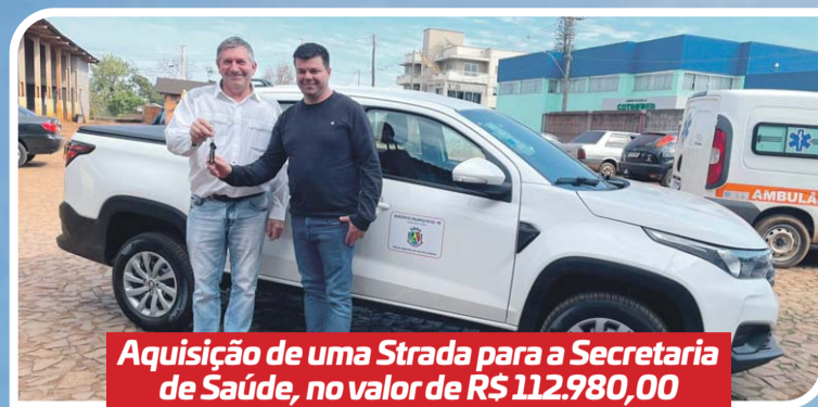
Aquisição de uma Strada para a Secretaria de Saúde, no valor de R$ 112.980,00