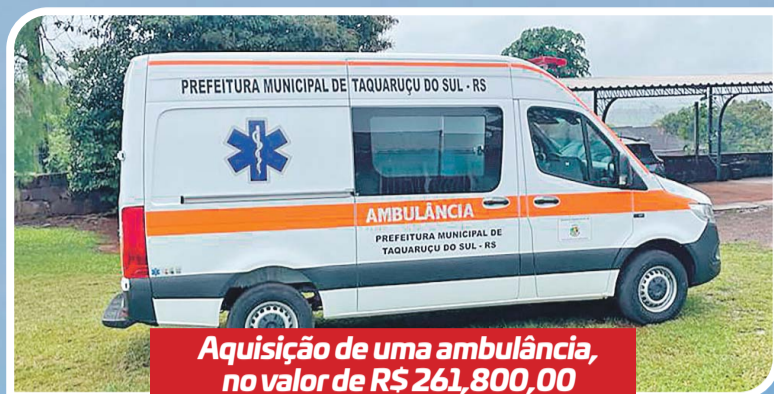
Aquisição de uma ambulância, no valor de R$ 261,800,00