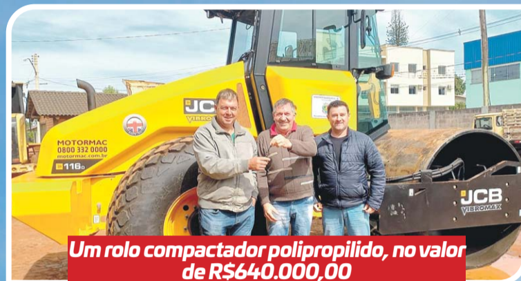
Um rolo compactador polipropilido, no valor de R$640.000,00