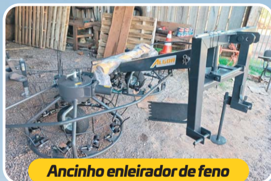
Ancinho enleirador de feno