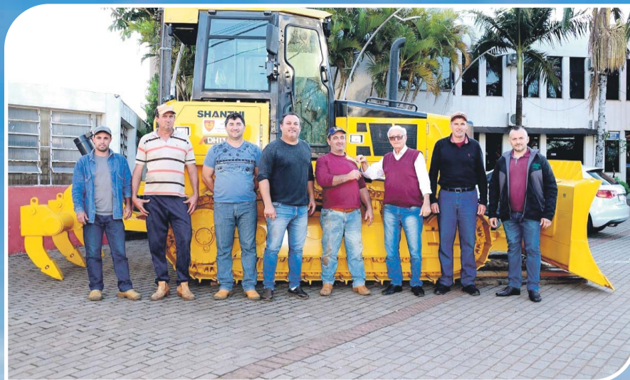
Aquisição de máquinas para a Secretaria da Agricultura e para a Secretaria de Obras e Viação, perfazendo um valor superior a R$ 2 milhões através de financiamento e recursos oriundos de ministérios.