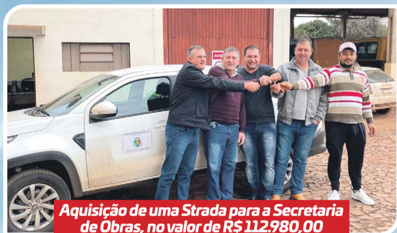
Aquisição de uma Strada para a Secretaria de Obras, no valor de R$ 112.980,00