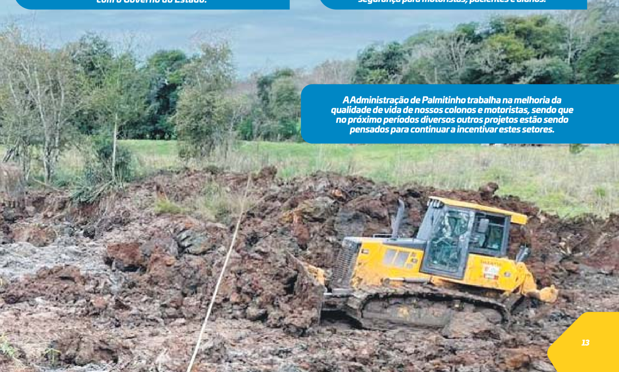
A Administração de Palmitinho trabalha na melhoria da qualidade de vida de nossos colonos e motoristas, sendo que no próximo períodos diversos outros projetos estão sendo pensados para continuar a incentivar estes setores.