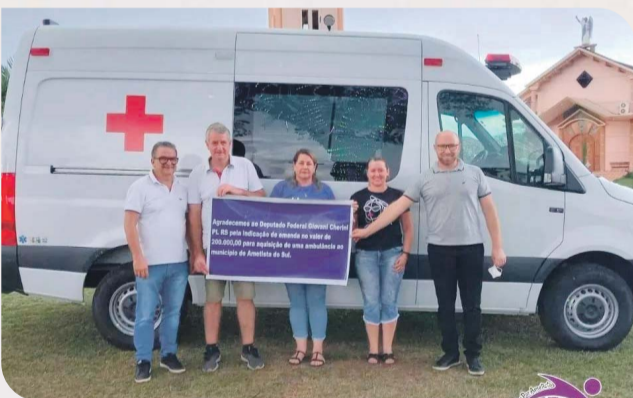
Aquisição ambulância zero km, no valor de R$ 240.900,00.