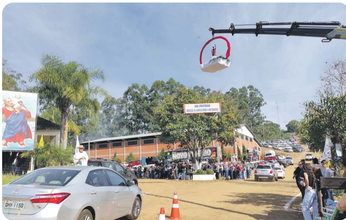
Sueli Cristó-Arguino / IV

O dia 25 de julho também é o Dia do Motorista, em homenagem ao protetor dos motoristas e dos viajantes: São Cristóvão. Em sua história, ele viveu na Síria e seu martírio aconteceu no século III. "Cristóvão" significa "aquele