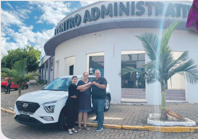
Aquisição de um veículo Creta, destinado para uso do gabinete do prefeito.