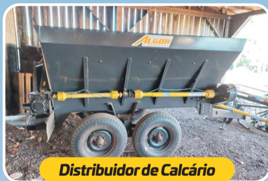
Distribuidor de Calcário