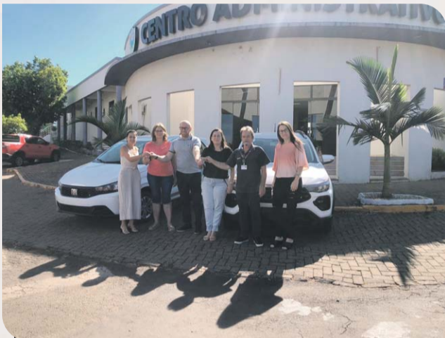
Aquisição de dois veículos, destinados para as secretarias da Saúde e Assistência Social.