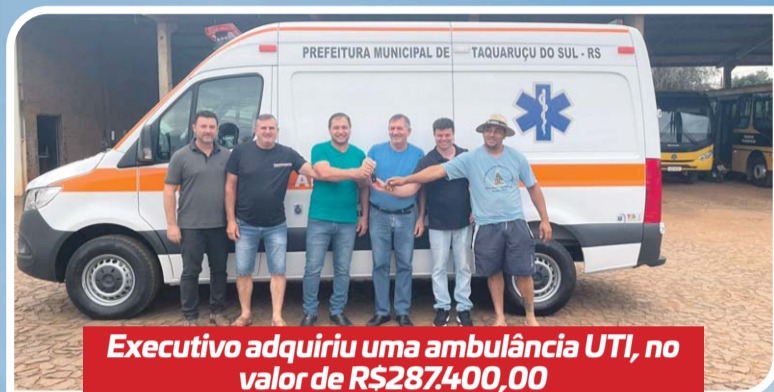
Executivo adquiriu uma ambulância UTI, no valor de R$287.400,00