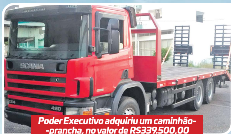
Poder Executivo adquiriu um caminhão- prancha, no valor de R$339.500,00