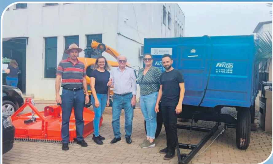
Novas Patrulhas Agrícolas, beneficiando diversos agricultores das linhas Caldeirão, Cordilheira do Guarita, Bom Fim, Zatti, Km 16, Lajeado Tateto, entre outros.