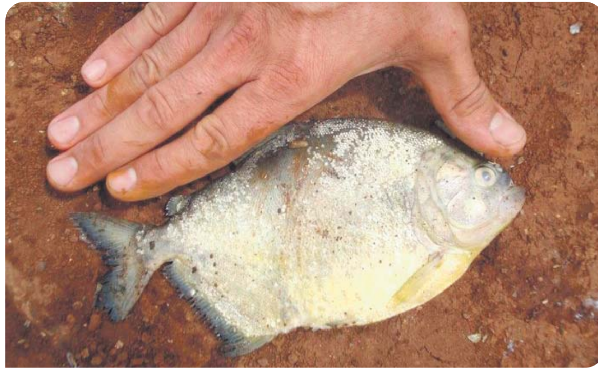
Fora de seu habitat natural, palometa causa desequilíbrio ambiental e prejuízos para os pescadores

Em 2022, na cidade de General Câmara, a prefeitura precisou conceder auxílio aos