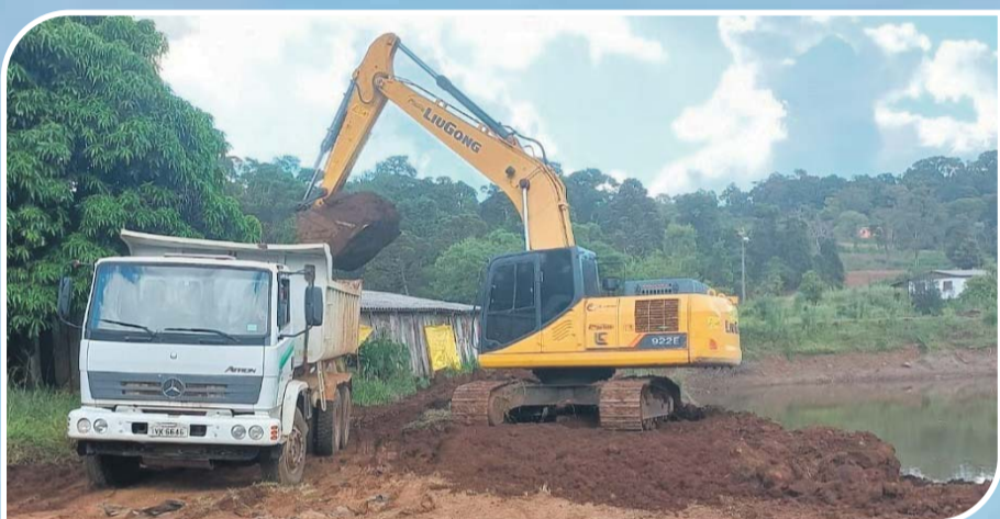
Limpeza e aberturas de dezenas de açudes e poços artesianos, visando prevenir futuros eventos de estiagens no município. Foram abertos ao menos 12 açudes comunitários através do Convênio Avançar na Agricultura, firmado com o Governo do Estado.