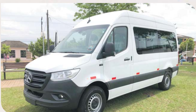
Aquisição de uma Van no valor de R$ 262.000,00, destinada a Secretaria da Saúde.