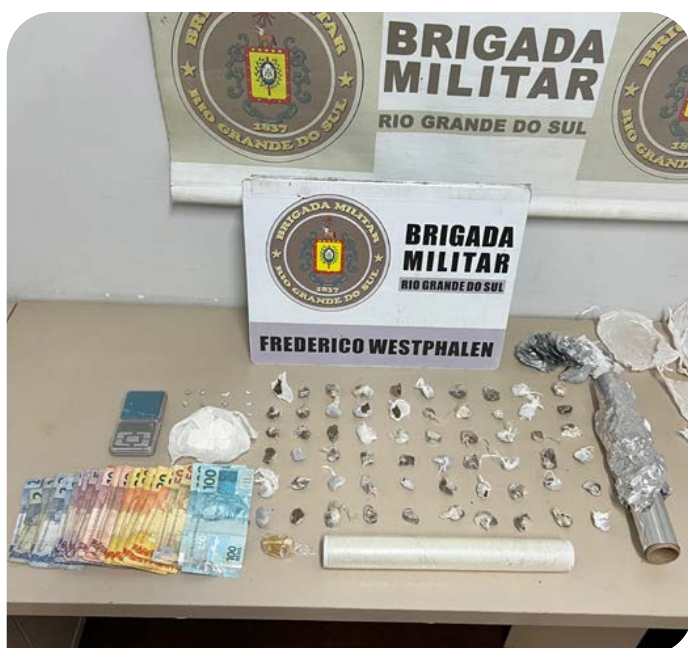
Material apreendido após a prisão da mulher