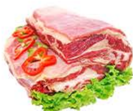
COSTELA MINGA BOVINA KG