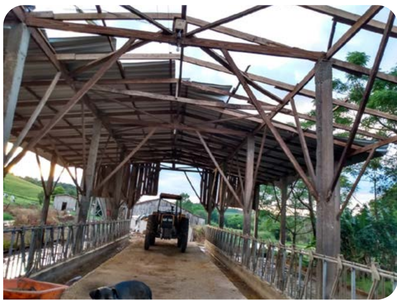
Taquaruçu do Sul

A Defesa Civil Regional realizou vistorias para o levantamento dos prejuízos. Segundo o órgão, ninguém ficou ferido e não houve desalojados. Em Taquaruçu do Sul, 10 famílias foram atingidas nas localidades de Barra do Fortaleza e Rincão, de acordo com informações da Defesa Civil Municipal. Vista Alegre e Palmitinho devem decretar, nos próximos dias, emergência em virtude dos prejuízos.