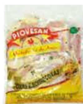
COXA E SOBRECOXA TEMPERADA PIOVESAN RESFRIADA 1 KG