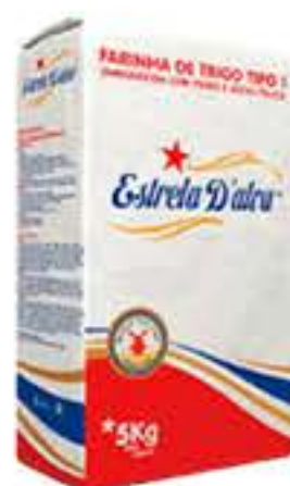
FARINHA DE TRIGO ESTRELA DALVA 5 KG