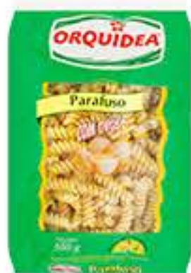
MASSA ORQUIDEA C/OVOS 500G