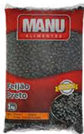
FEIJÃO PRETO MANU 1KG