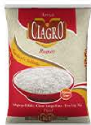
ARROZ CIAGRO 5KG