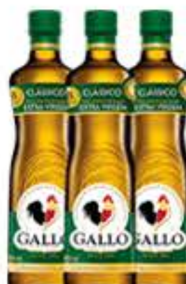
AZEITE OLIVA GALLO EXTRA VIRGEM 500 ML