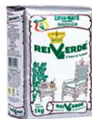
ERVA MATE REI VERDE PACOTE DE PAPEL 1KG