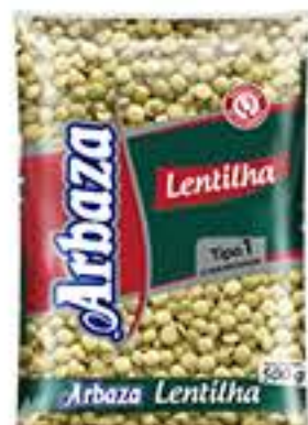
LENTILHA ARBAZA 500G