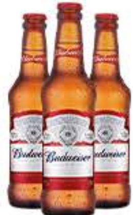
CERVEJA BUDWEISER 330ML LONG NECK