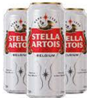
CERVEJA STELLA ARTOIS 473ML