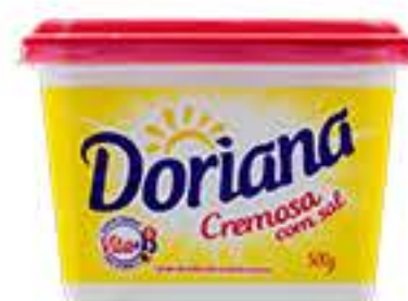
MARGARINA DORIANA 500G