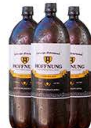
CHOPP HOFFNUNG PILSEN 2L