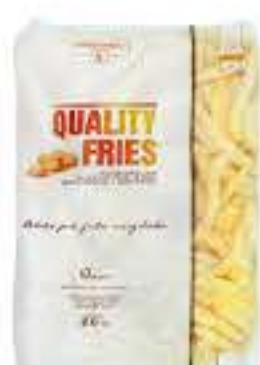
BATATA PALITO QUALITY FRIES PRE FRITA 2KG