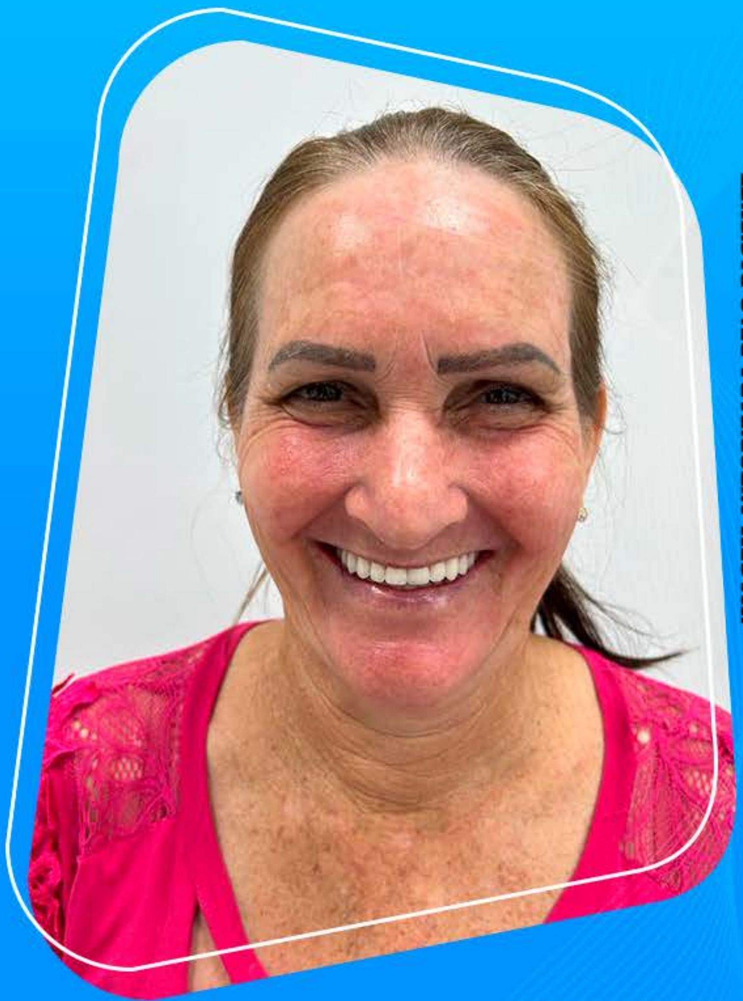
IMAGEM AUTORIZADA PELO PACIENTE.

FAÇA COMO ELA VENHA FAZER UMA AVALIAÇÃO 📞 55 9.8474-2020