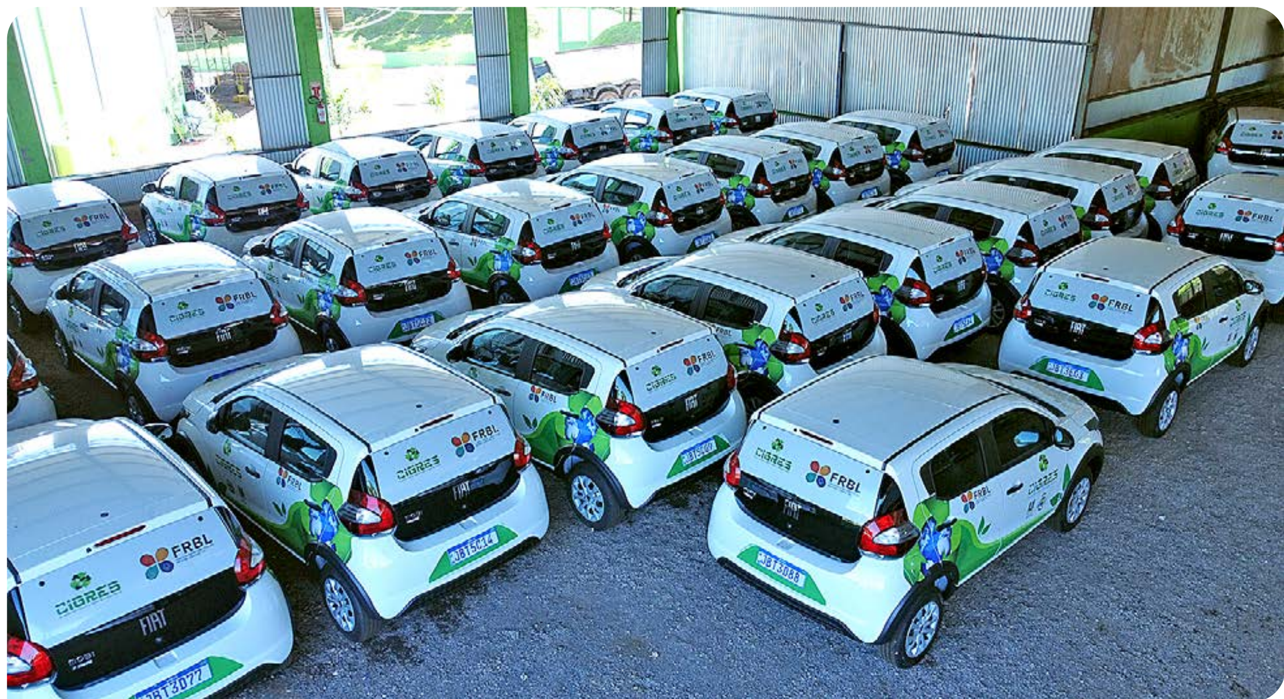
Veículos Fiat Mobi, além de equipamentos eletrônicos, serão entregues aos municípios