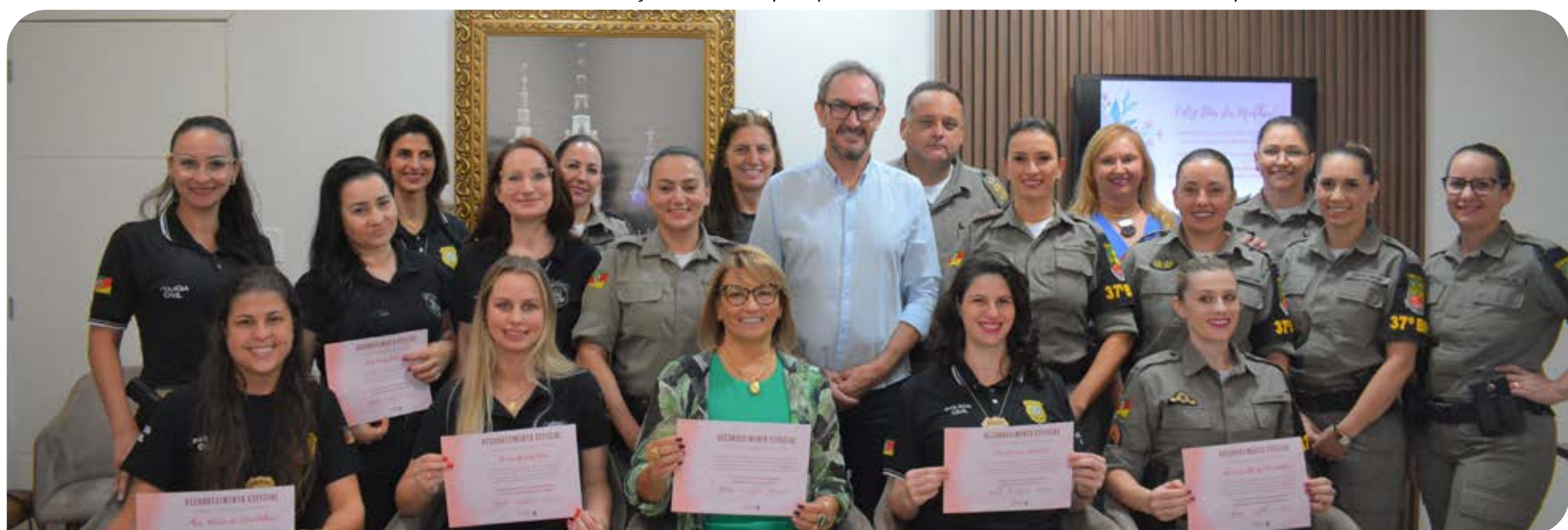
Mulheres receberam um certificado da administração municipal pelo trabalho realizado no município