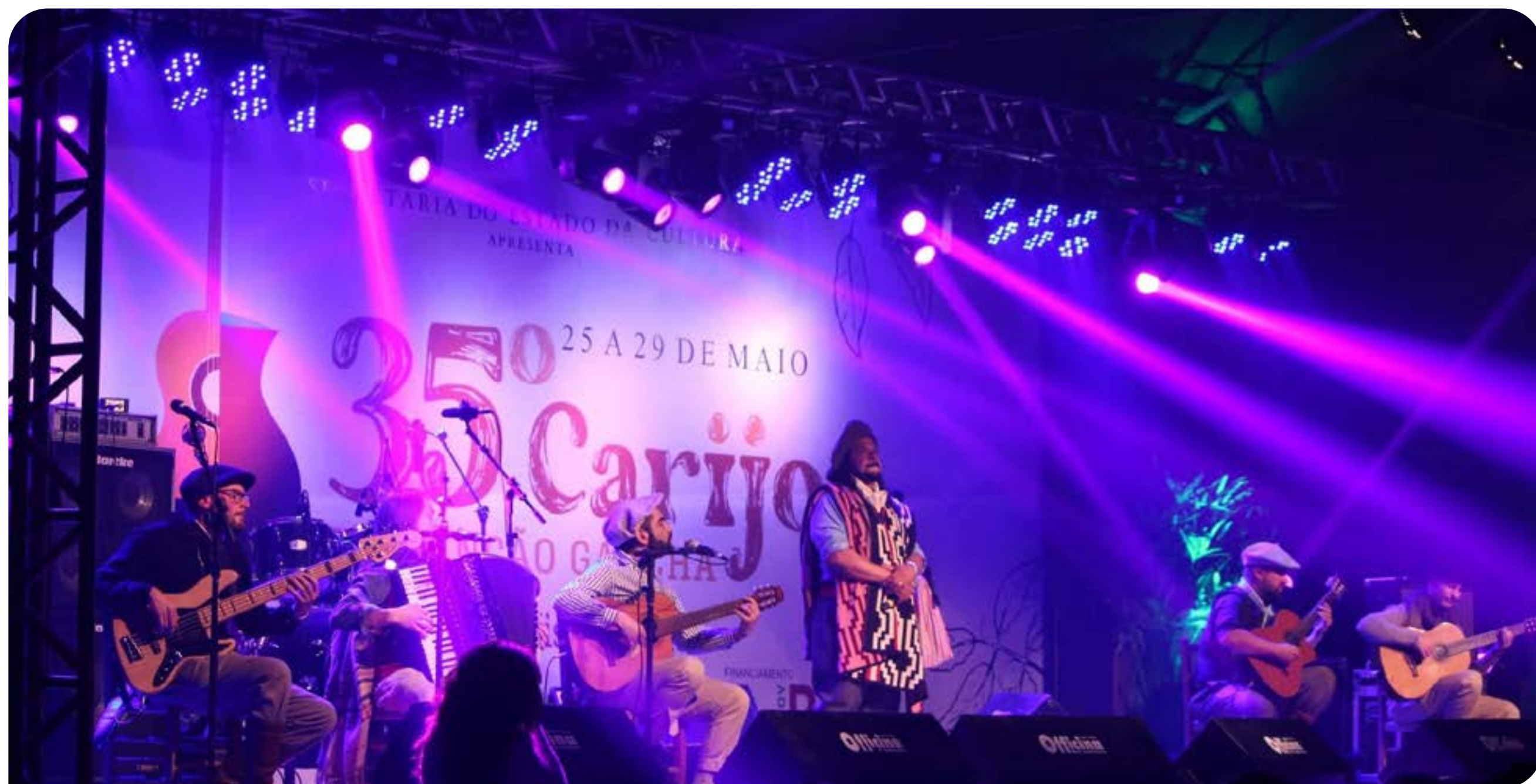
No ano passado, festival teve 28 canções selecionadas

nadas e concorreram a R$ 51 mil em prêmios. O evento contabilizou outros números expressivos, como 15 shows ao vivo, 52 veículos de comunicação credenciados, 13 crianças e jovens finalistas do Carijinho; nove internadas de CTGs participando do 1º Carijo em Dança, mais de 50 expositores na 20ª Mostra da Indústria, Agroindústria, Comércio e Artesanato de Palmeira das Missões (20ª MIP) e mais de 200 terrenos ocupados na Cidade de Lona.