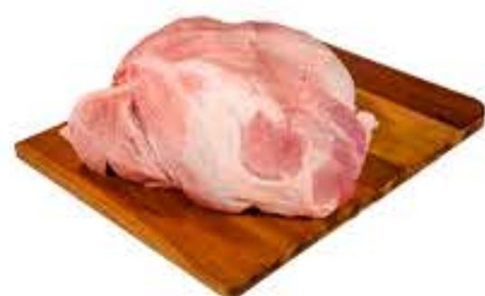
PALETA SUÍNA SEM PELE KG R$ 12,98