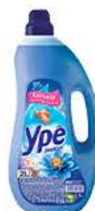
AMACIANTE YPE 2L R$ 6,98