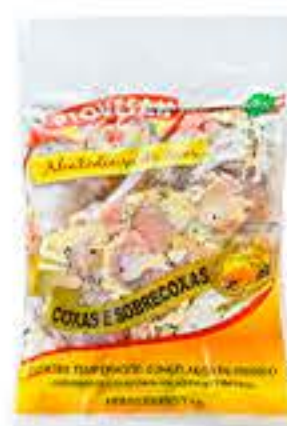
COXA COM SOBRECOPA DE FRANGO PIOVESAN TEMPERADA 1KG RESF R$ 9,98