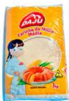
FARINHA DE MILHO DAJU 1KG R$ 3,45