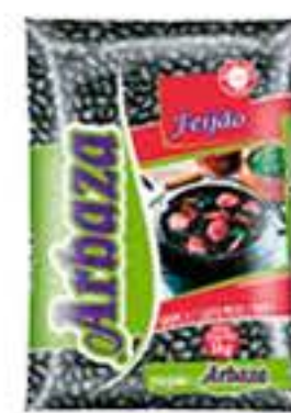
FEIJÃO PRETO ARBAZAT 1KG R$ 6,98