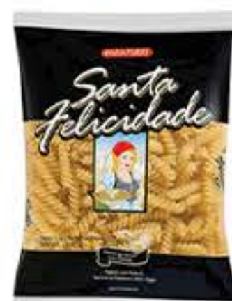
MASSA SANTA FELICIDADE COM OVOS 500 G R$ 2,99