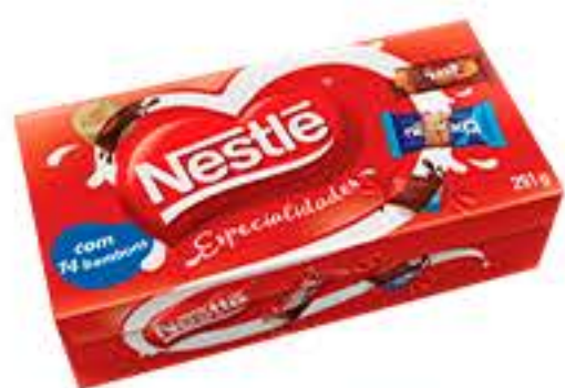
BOMBOM NESTLE ESPECIALIDADES 251G R$ 9,98