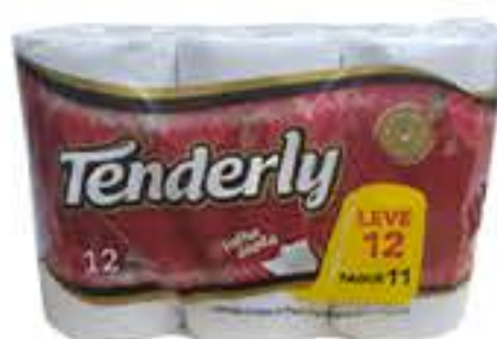
PAPEL HIGIÊNICO TENDERLY FOLHA DUPLA NEUTRO 30M LEVE 12 PAGUE 11 R$ 15,75