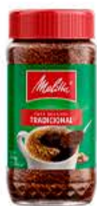
CAFÉ SOLÚVEL MELITTA GRANULADO VIDRO 200G R$ 15,98