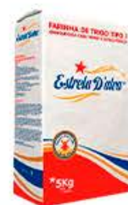
FARINHA TRIGO ESTRELA D'ALVA 5KG R$ 17,75