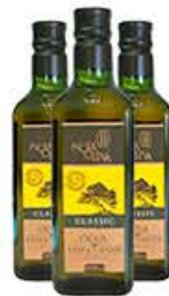
AZEITE OLIVA NOVA OLIVA 500ML EXTRA VIRGEM R$ 26,75