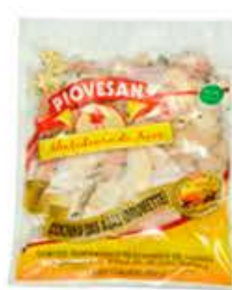
COXINHA ASA PIOVESAN TEMPERADA 800G RESF R$ 10,98