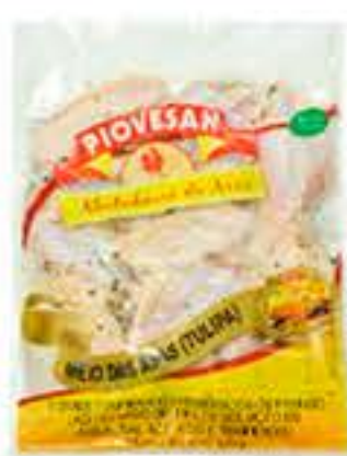
TULIPA DE FRANGO PIOVESAN TEMPERADA 800G RESF R$ 14,98