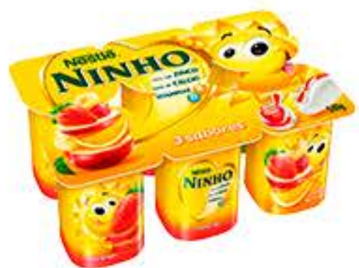
IOGURTE NESTLE NINHO SOL POLPA 540G/6UND BANDEJA R$ 6,65