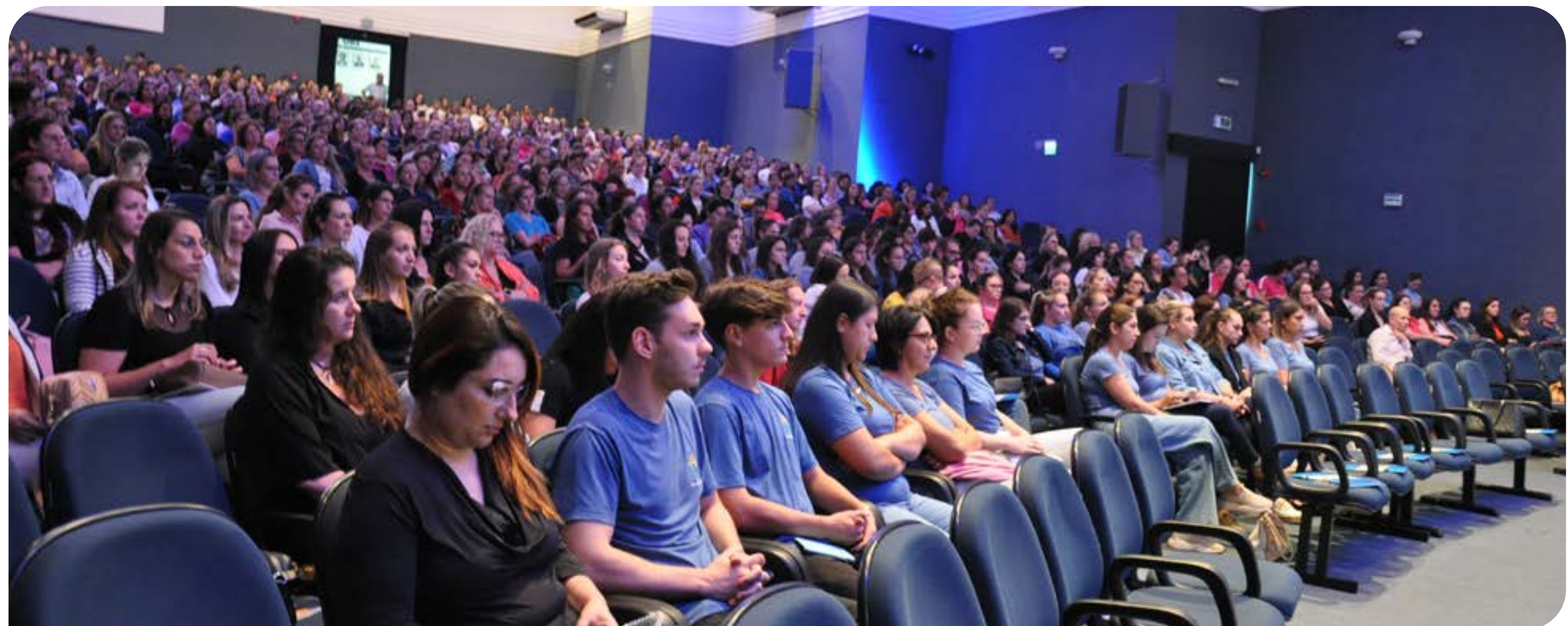
Mais de 700 pessoas participaram do evento