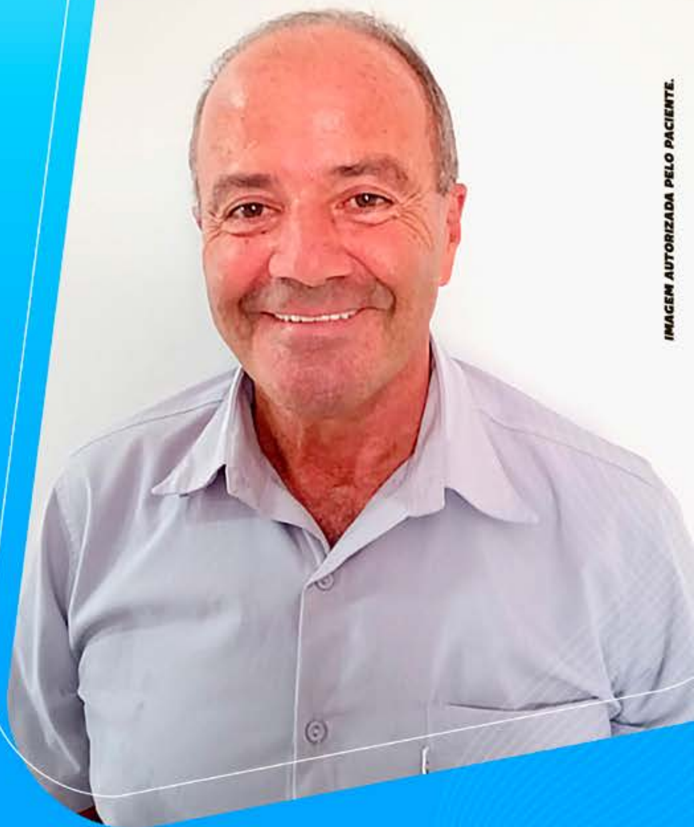
IMAGEM AUTORIZADA PELO PACIENTE.