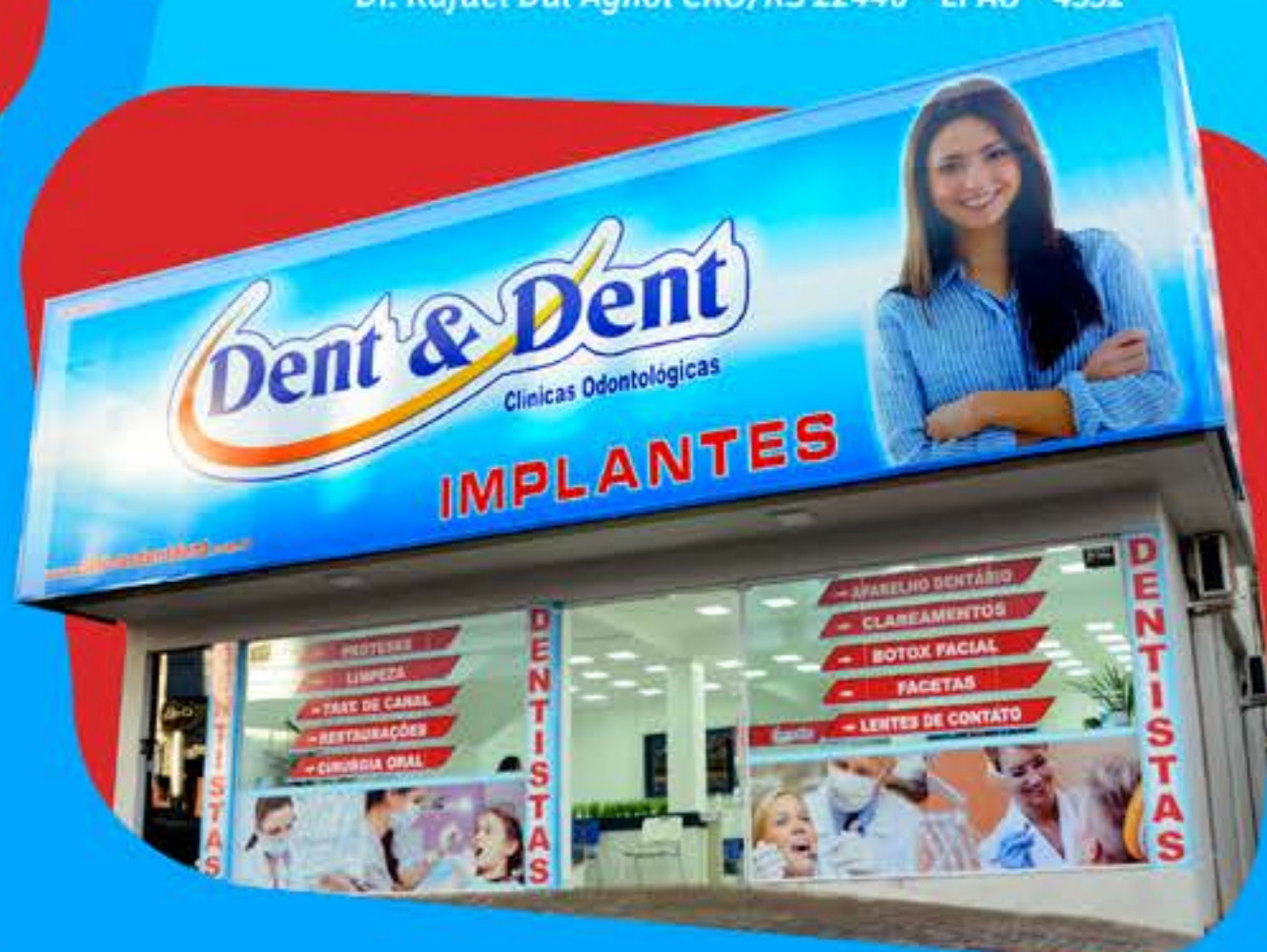
IMAGEM AUTORIZADA PELO PACIENTE.