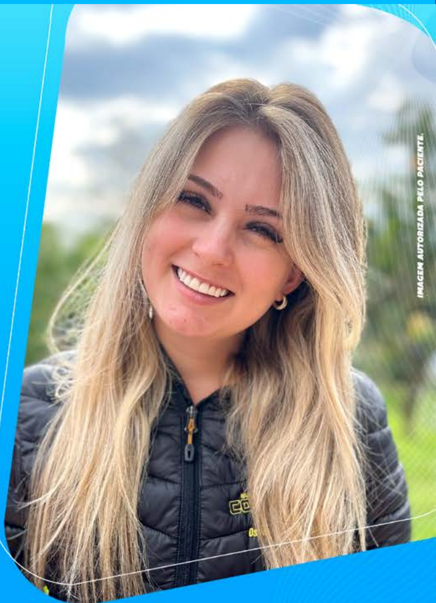
IMAGEM AUTORIZADA PELO PACIENTE.