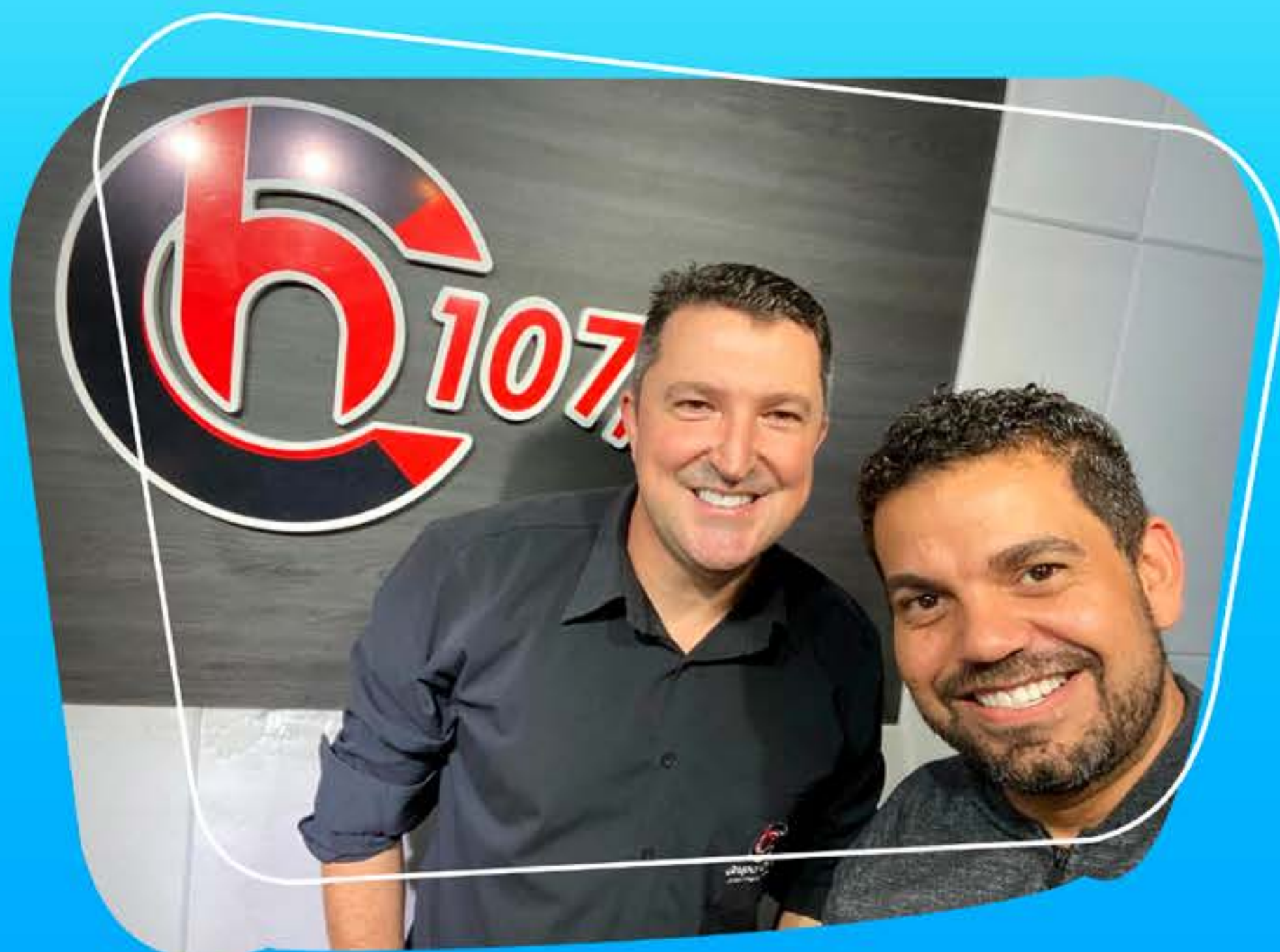
IMAGEM AUTORIZADA PELO PACIENTE

Agradecemos a preferência e confiança dos pacientes