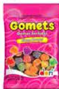
GOMA DORI GOMETS 150G