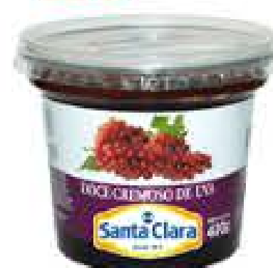
DOCE CREMOSO DE FRUTAS SANTA CLARA 400G