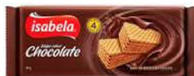
WAFER ISABELA 100G