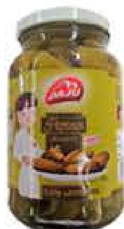
PEPINO DAJU CONSERVA 300G