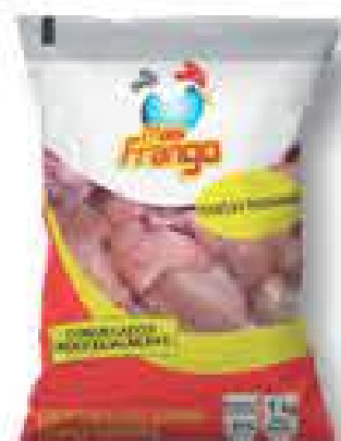
FRANGO A PASSARINHO MAIS FRANGO IQF 1KG