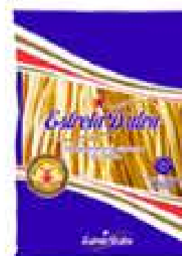
MASSA ESTRELA D'ALVA C/OVOS 400G