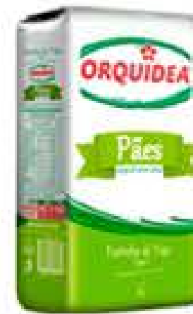
FARINHA DE TRIGO ORQUÍDEA PÃES 5KG