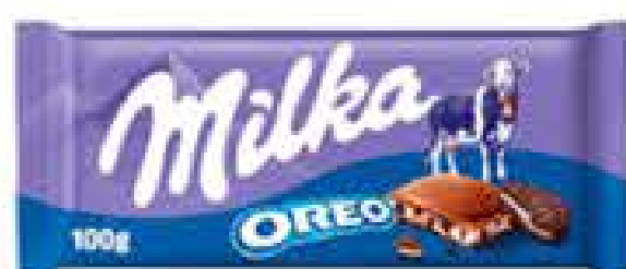
CHOCOLATE MILKA 100G