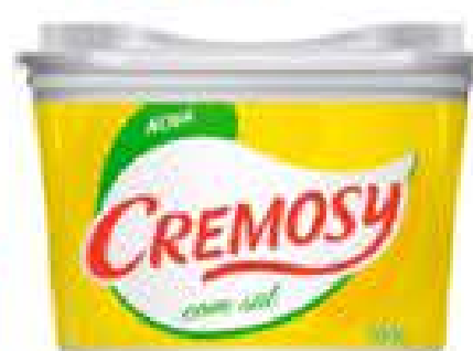
MARGARINA CREMOSY C/S 500G