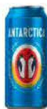
CERVEJA ANTARCTICA LATÃO 473ML