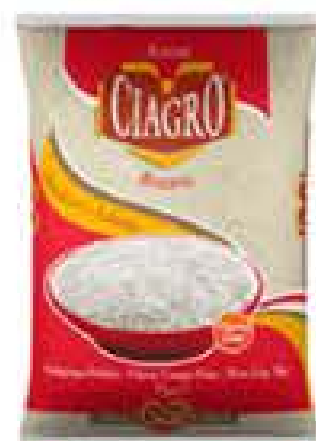
ARROZ CIAGRO TP1 5KG