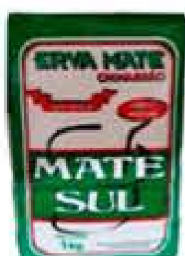
ERVA MATE MATE SUL S/AÇUCAR 1KG