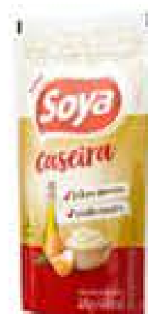
MAIONESE SOYA 500G SACHE