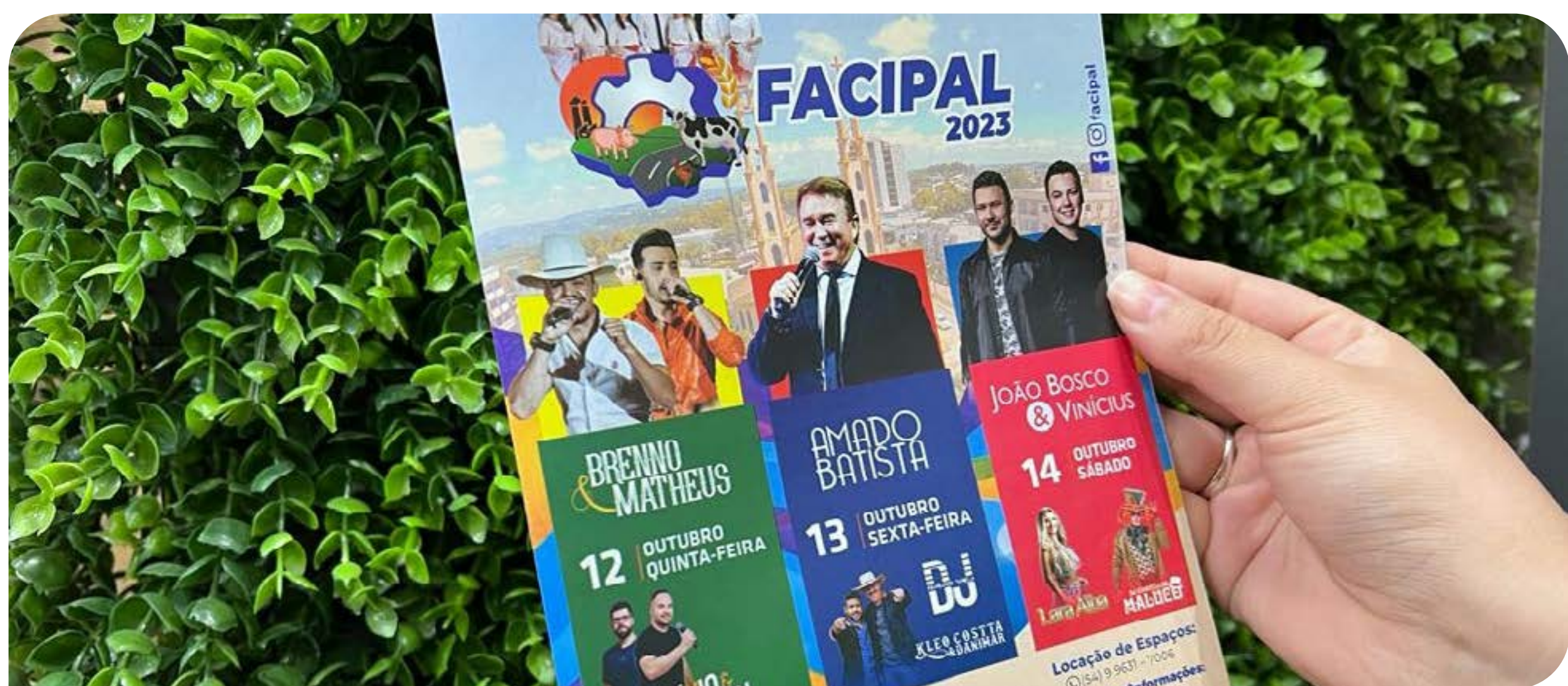
Jornal O Alto Uruguai

Após uma década de pausa, o evento conta com atrações que vão de apresentações municipais e regionais, à shows nacionais, com o objetivo de atrair e encantar todos os públicos.