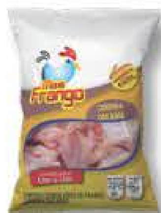
COXINHA ASA MAIS FRANGO ABRE FÁCIL 1KG