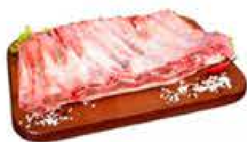
COSTELA CONGELADA JANELA KG