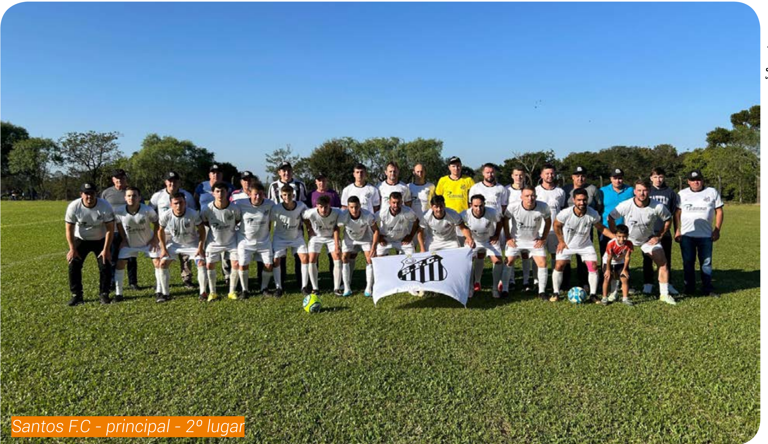
Santos F.C - principal - 2º lugar