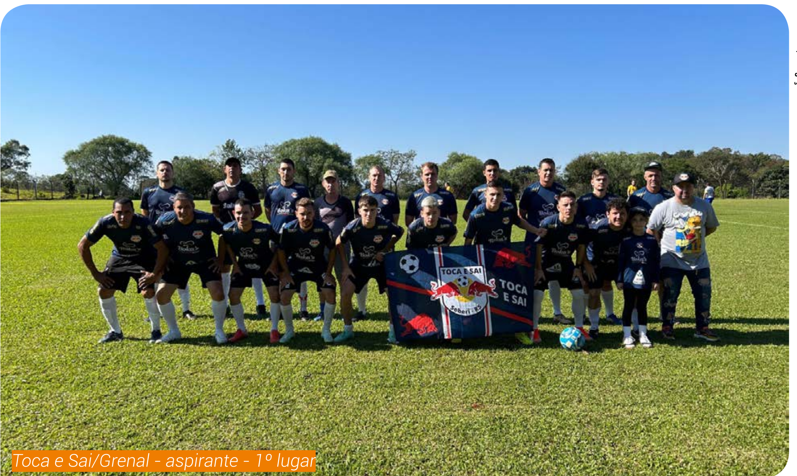
Toca e Sai/Grenal - aspirante - 1º lugar