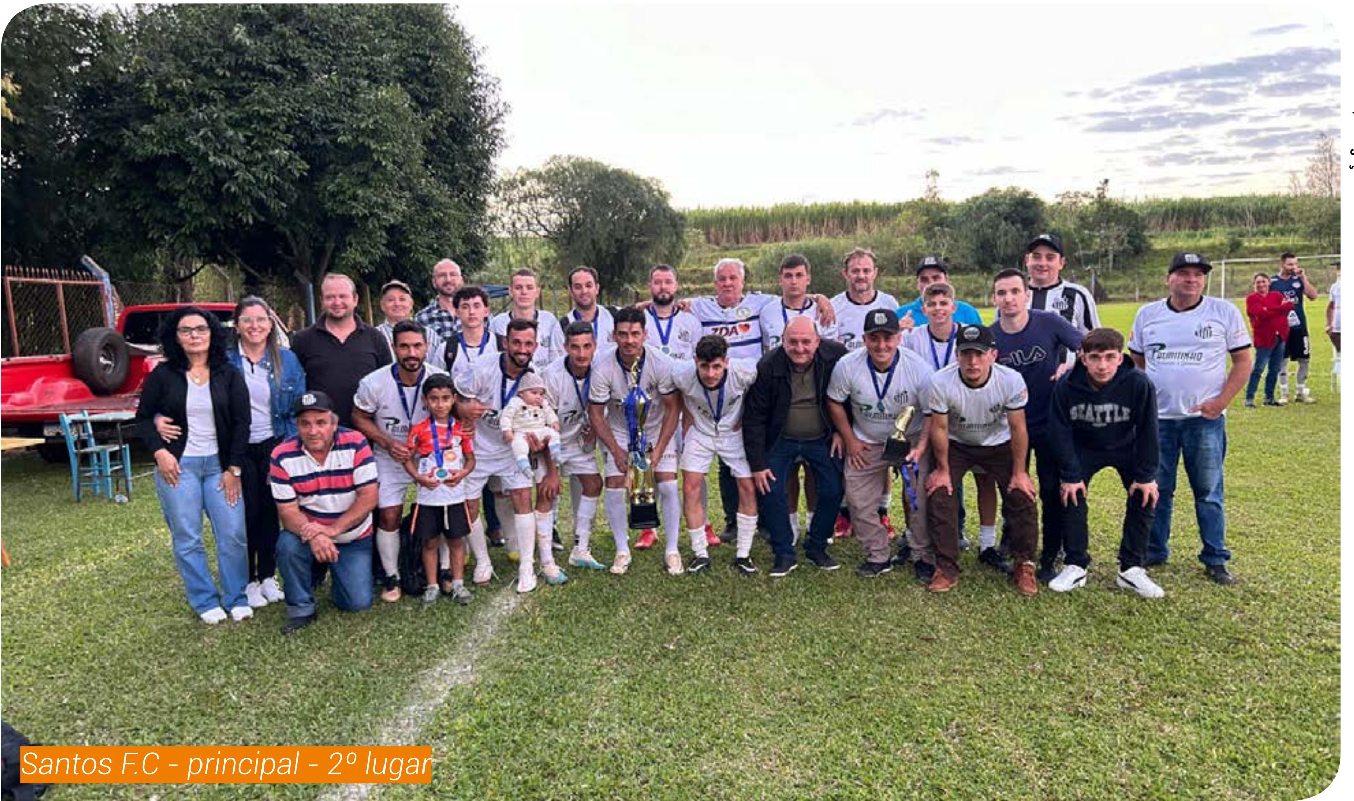
Santos F.C - principal - 2º lugar