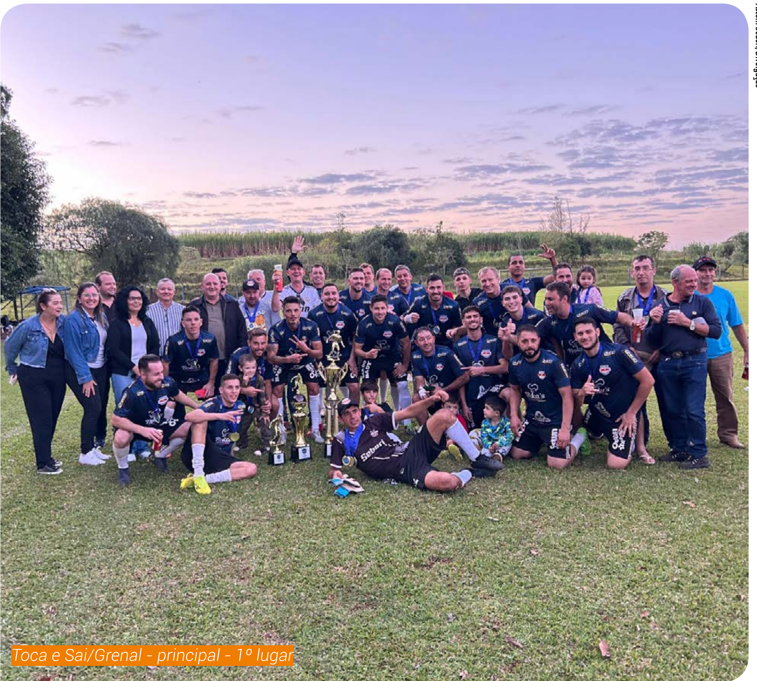
Toca e Sai/Grenal - principal - 1º lugar