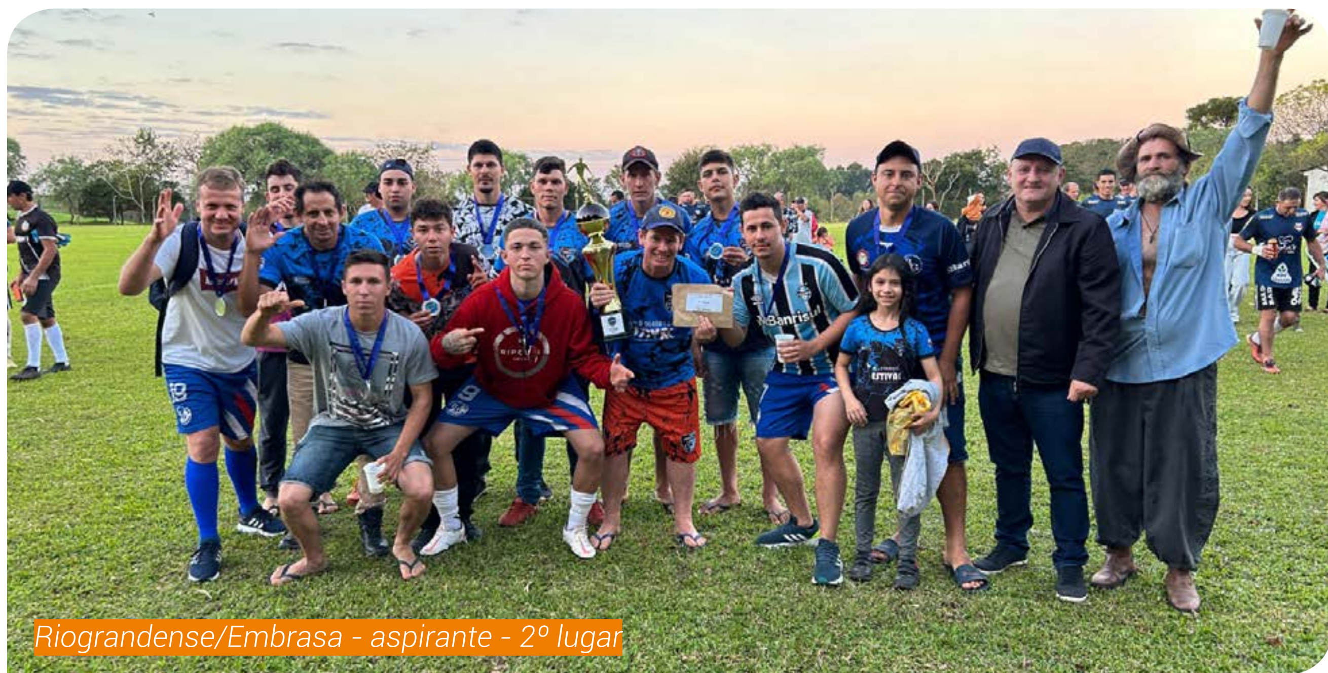
Riograndense/Embrasa - aspirante - 2º lugar

O evento contou com a presença de muitos torcedores que vibraram e apoiaram seus times do início ao fim. As equipes demonstraram grande habilidade, espírito esportivo e determinação, o que tornou a final um espetáculo inesquecível. Ainda, foram premiados as melhores equipes e melhores jogadores do campeonato.