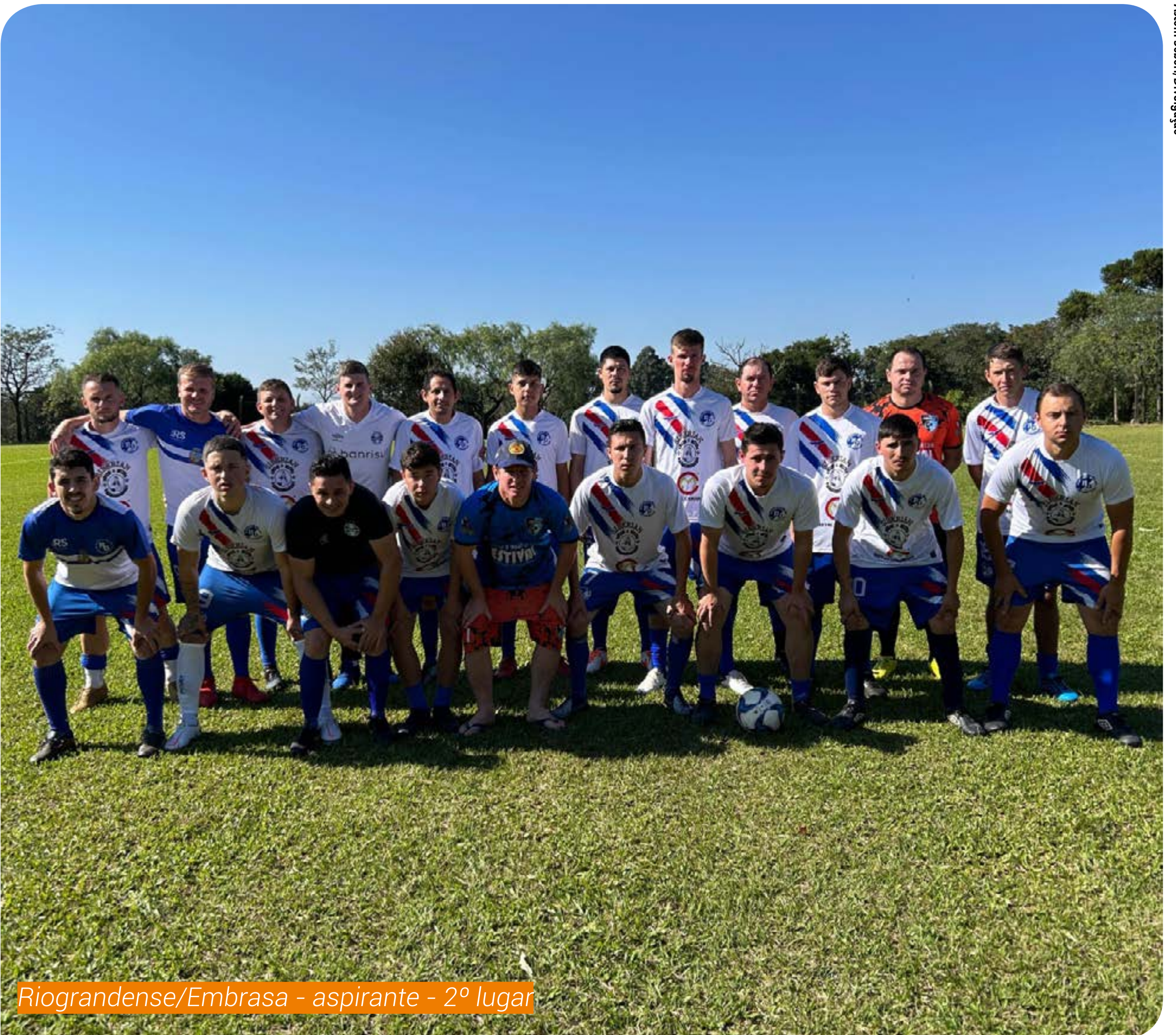
Riograndense/Embrasa - aspirante - 2º lugar