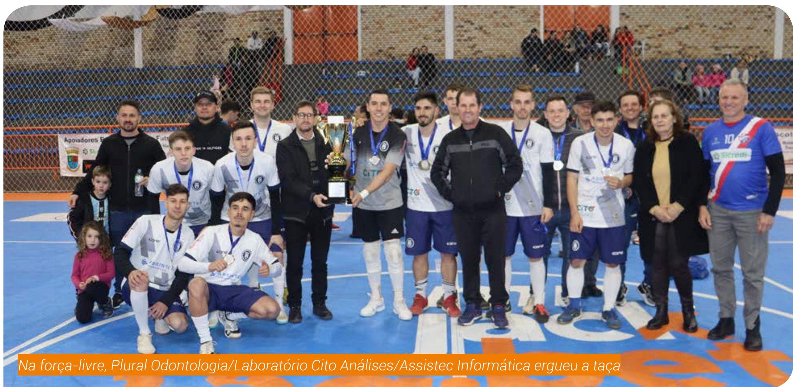
Na força-livre, Plural Odontologia/Laboratório Cito Análises/Assistec Informática ergueu a taça

A competição foi promovida pela Administração de Rodeio Bonito junto com a Secretaria Municipal de Educação Cultura e Desporto, com apoio do Conselho Municipal de Desporto (CMD).