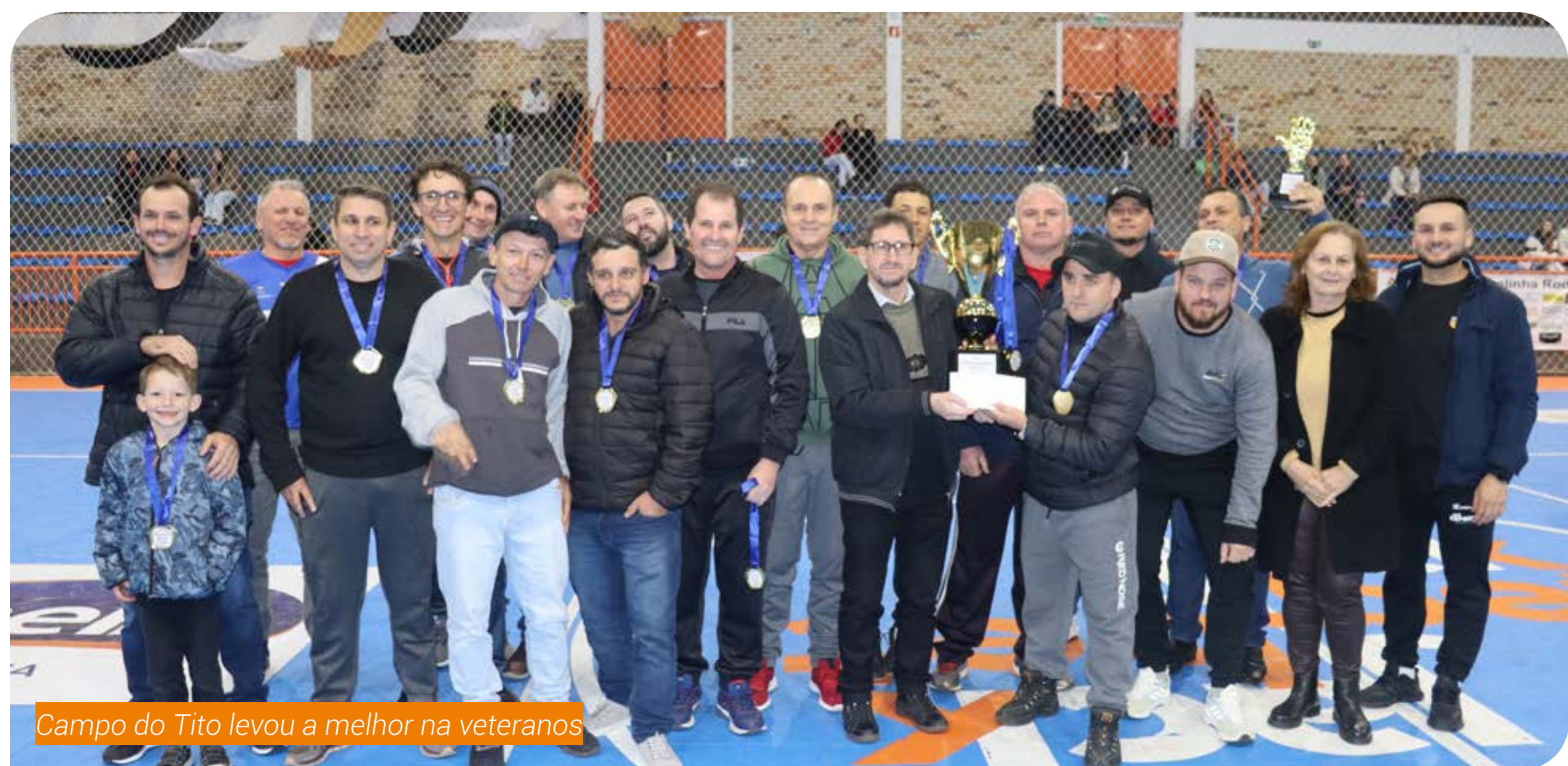
Campo do Tito levou a melhor na veteranos