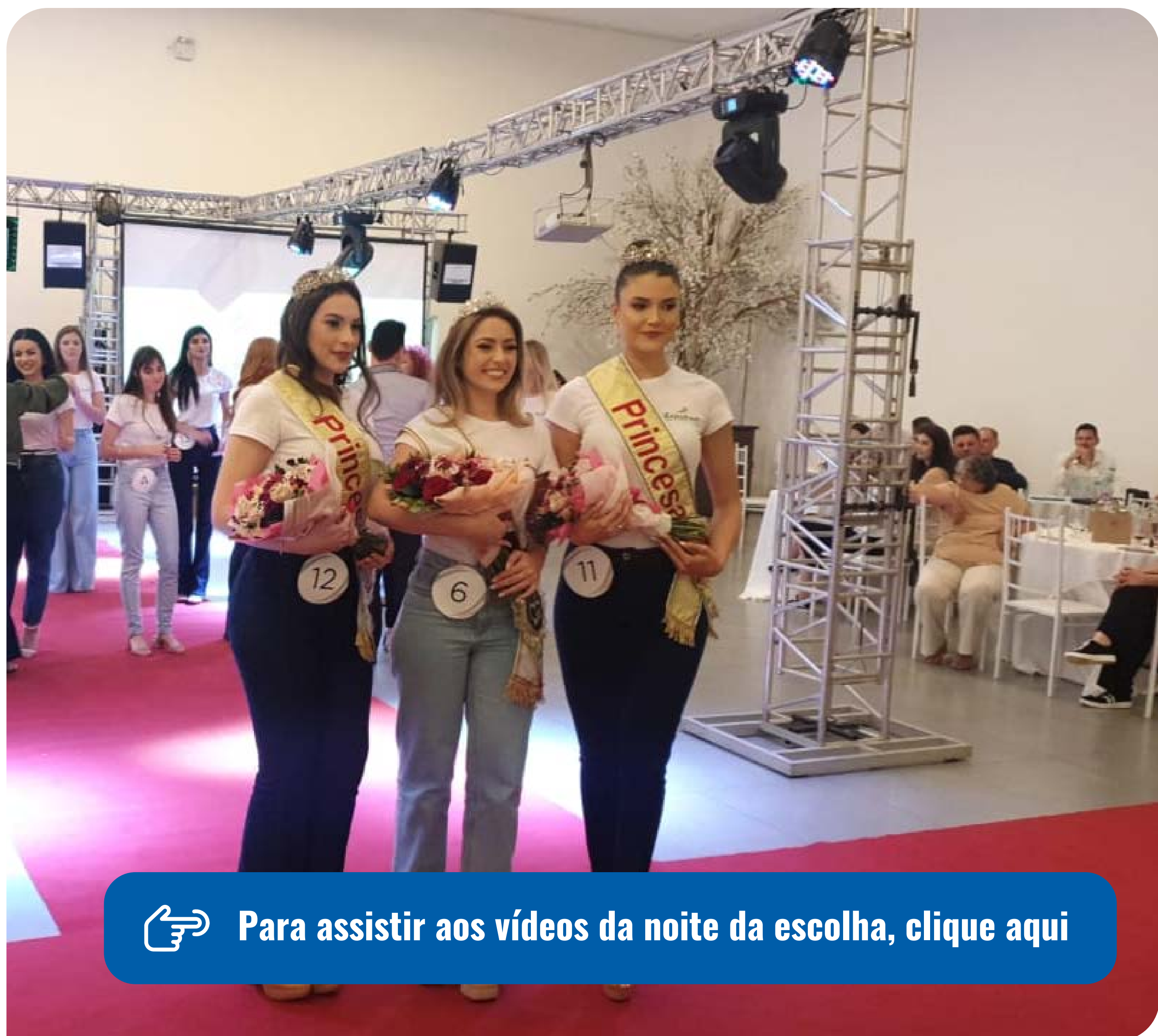
Redação jornal o alto Uruguai

Confira a matéria completa na edição impressa de sábado, 26.